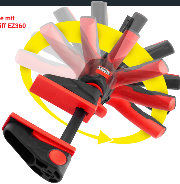
Einhandzwinge mit drehbarem Griff EZ360