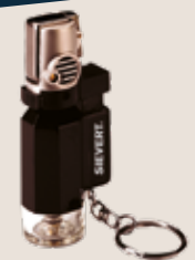
Micro Lötbrenner Turbo Lite Torch