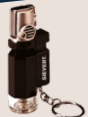
Micro Lötbrenner Turbo Lite Torch