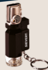
Micro Lötbleibner Turbo Lite Torch