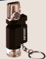
Micro Löt Brenner Turbo Lite Torch